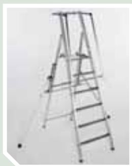
Leiter komplett mit Ausleger