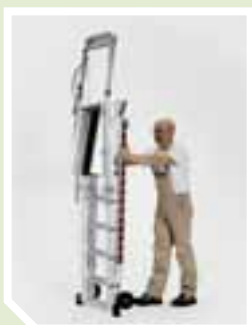
Platz sparend zusammen- klappbar