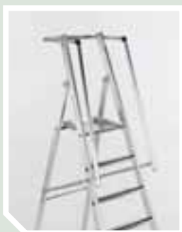
Beidseitiger Handlauf am Aufstieg