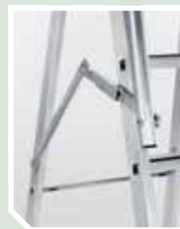
Platz sparend zusammenklappbar