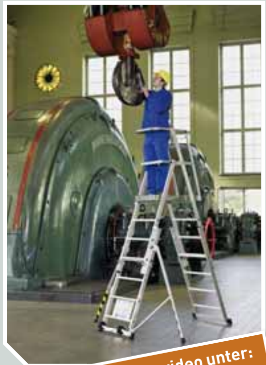
Platz sparend zusammenklappbar