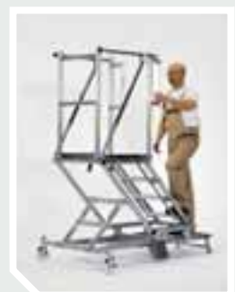
Öffnen der Sicherheitstüre