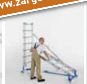
Leicht zusammenklappbar durch Knickstreben