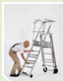
Höhenverstellung der ZAP Teleskop-Plattformleiter