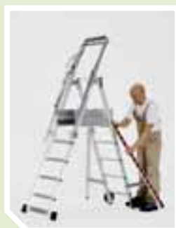
Ausklappen der Ausleger