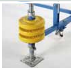
Ausleger mit Ballastierung beim Einsatz im Außenbereich