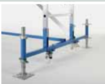
Fahrwerk mit Spindel