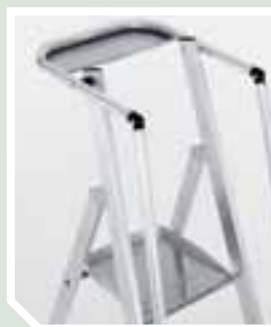
Sicherheitskäfig mit Ablage