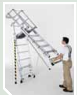
Auch im aufgeklappten Zustand verfahrbar